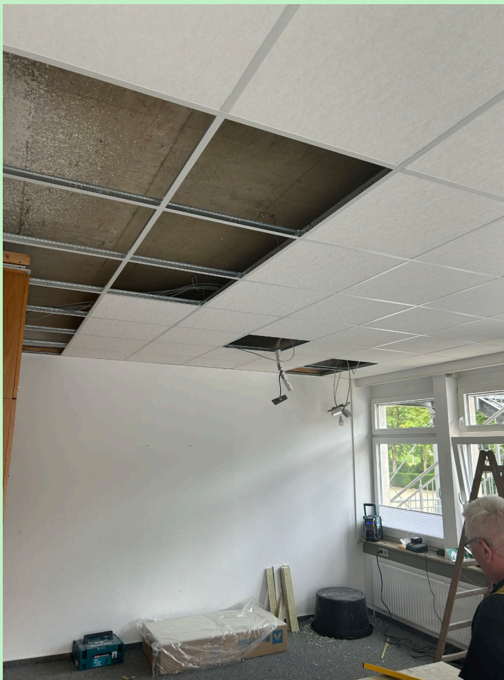
Rathaus - Einwohnermeldeamt

Im Außenbereich wird die gute Arbeit unseres Bauamtes besonders auch im Bereich der Zugangstreppe sichtbar.