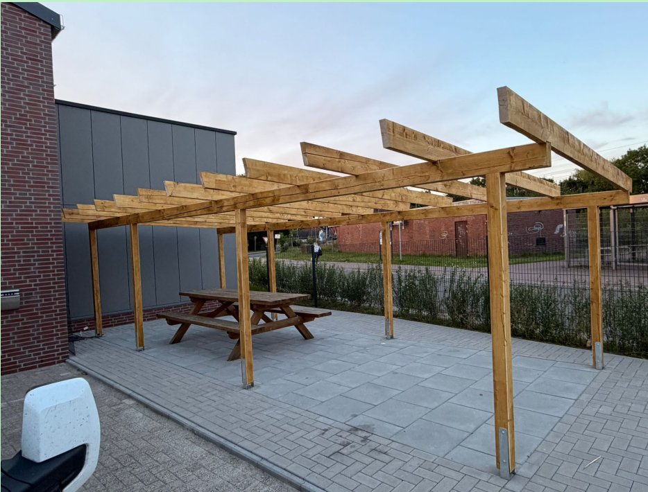
Freisitz bei der FF Rodenkirchen

Wenn uns der Abschluss aller Baustellen rechtzeitig gelingt und wir die Planungen rechtzeitig aufnehmen können, wollen wir dann auch gern die offizielle Einweihung des Hauses mit einem Tag der offenen Tür begehen.